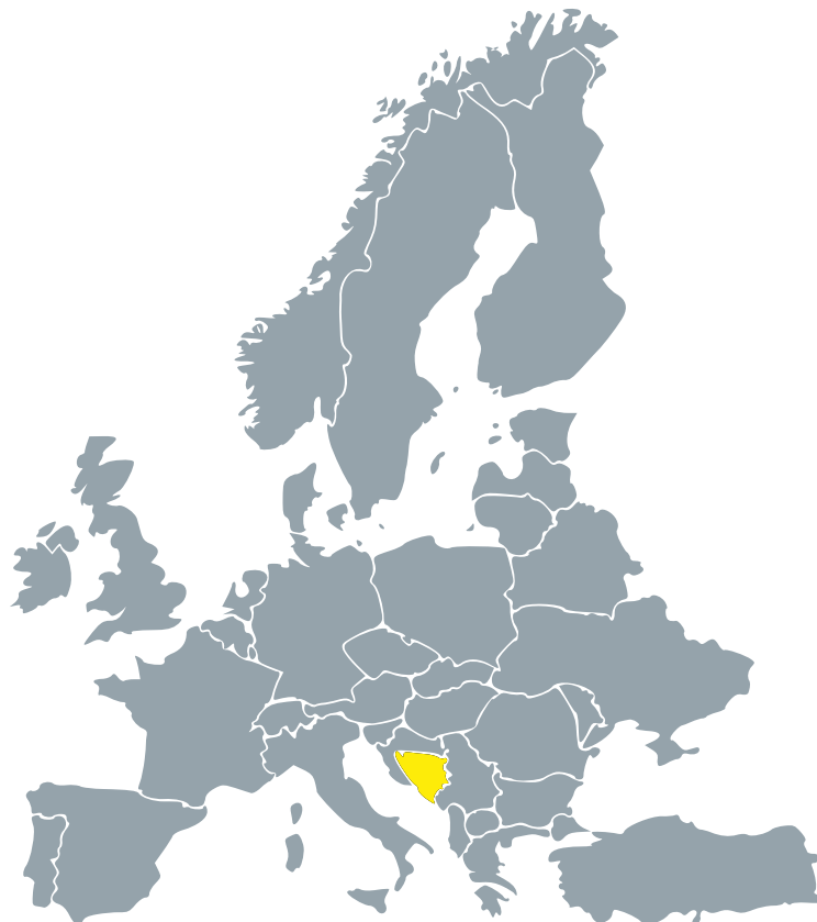
Pozicija BiH u regiji

Općina Žepče smještena je u Srednjoj Bosni, u Zeničko – dobojskom kantonu, na najvažnijoj trasi koja povezuje Istočnu Europu i Jadransko more (E73 ili M17: Bos.Samac-Sarajevo-Mostar).