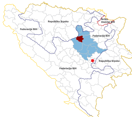
Pozicija Općine Žepče u BiH i u Zeničko-dobojskom kantonu